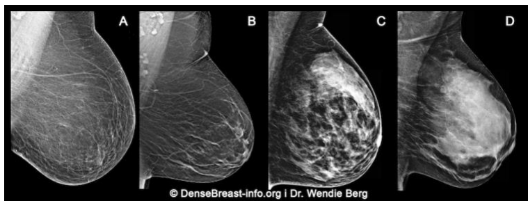
(C) Heterogeno guste ili (D) izrazito guste se smatraju "gustim dojkama."