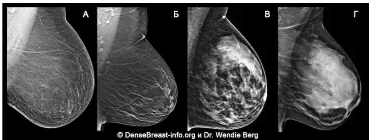
В) Неоднородно плотная и (Г) Чрезвычайно плотная категории свидетельствуют о высокой плотности груди