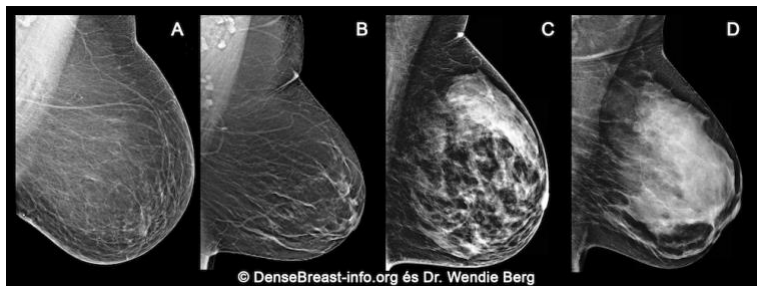
A (C) heterogén denz és a (D) kifejezetten denz emlőszövet összefoglaló neve: denz emlőszövet.