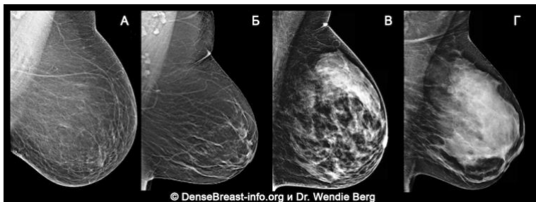
В) Неоднородно плотная и (Г) Чрезвычайно плотная категории свидетельствуют о высокой плотности груди