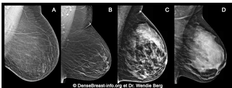
(C) Les seins denses hétérogènes ou (D) extrêmement denses sont considérés comme des « seins denses. »